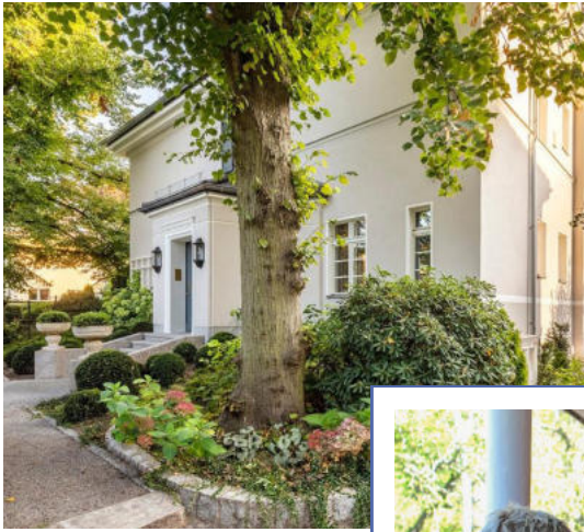
REFERENZOBJEKT IM BERLINER SÜDWESTEN